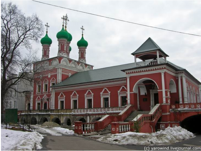
Церковь во имя преподобного Сергия Радонежского

Святые врата, которые построил Пётр I, имели три арки. Центральная предназначалась для тех, кто въезжал на лошадях, а боковые – для пеших. В южной части врат в 1905 г. была устроена часовня, в которой постоянно читался акафист. В советское время в центральной части был устроен гараж, а в проходе, где была часовня, сделали два этажа. На втором этаже была дежурная комната для водителей, а внизу – жестяная мастерская. В результате всех этих издевательств монастырь стал разрушаться. В 50-х годах состоялся Градостроительный совет, на котором решили расширить улицу Петровку, убрав мешающие для этого здания