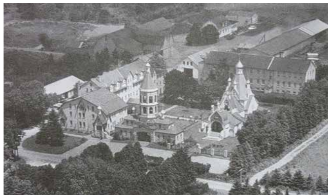
Свято-Троицкий монастырь (Джорданвилль)