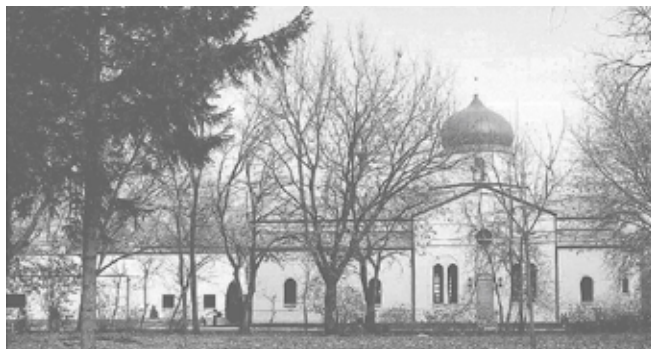
Покровский собор в Чикаго

деньги. Ну и я решил идти до конца, решил купить.