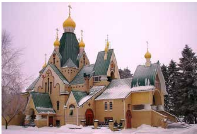
Храм в Джорданвилле

прут и ударял молотом, продвигая прут, пока он не был согнут в дугу. Концы дуги загибали приблизительно на два дюйма (5 см). В нужном месте в стене особым зубилом мы пробивали дырки, в которые вставляли концы дуг, а сверху прикрепляли проволокой дуги к стропилам. Когда нужный ряд дуг был установлен, их скрепляли поперечными прутьями, связав их проволокой. Каждый угол квадрата (приблизительно 18 на 18 дюймов, т. е. 45 см) прикрепляли проволокой к стропилам.