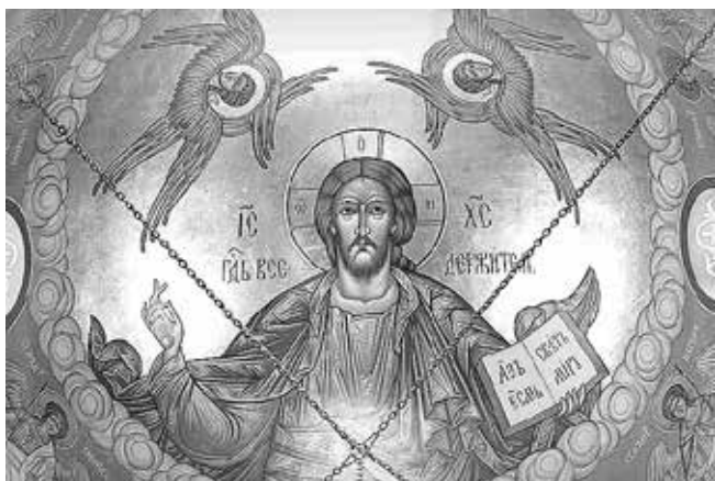
Спаситель. Фрагмент внутренней росписи (купол) Покровского собора в Чикаго. Собор полностью расписан владыкой Алипием

Последние три года он был очень слаб, переехал в Магопак и вскоре преставился (в 1987 г.). Вечная ему память! Вскоре меня назначили правящим архиереем.